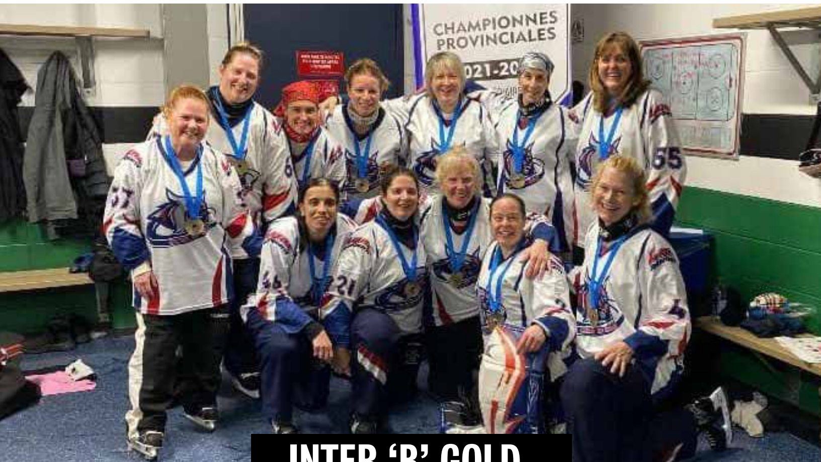
INTER 'B' GOLD