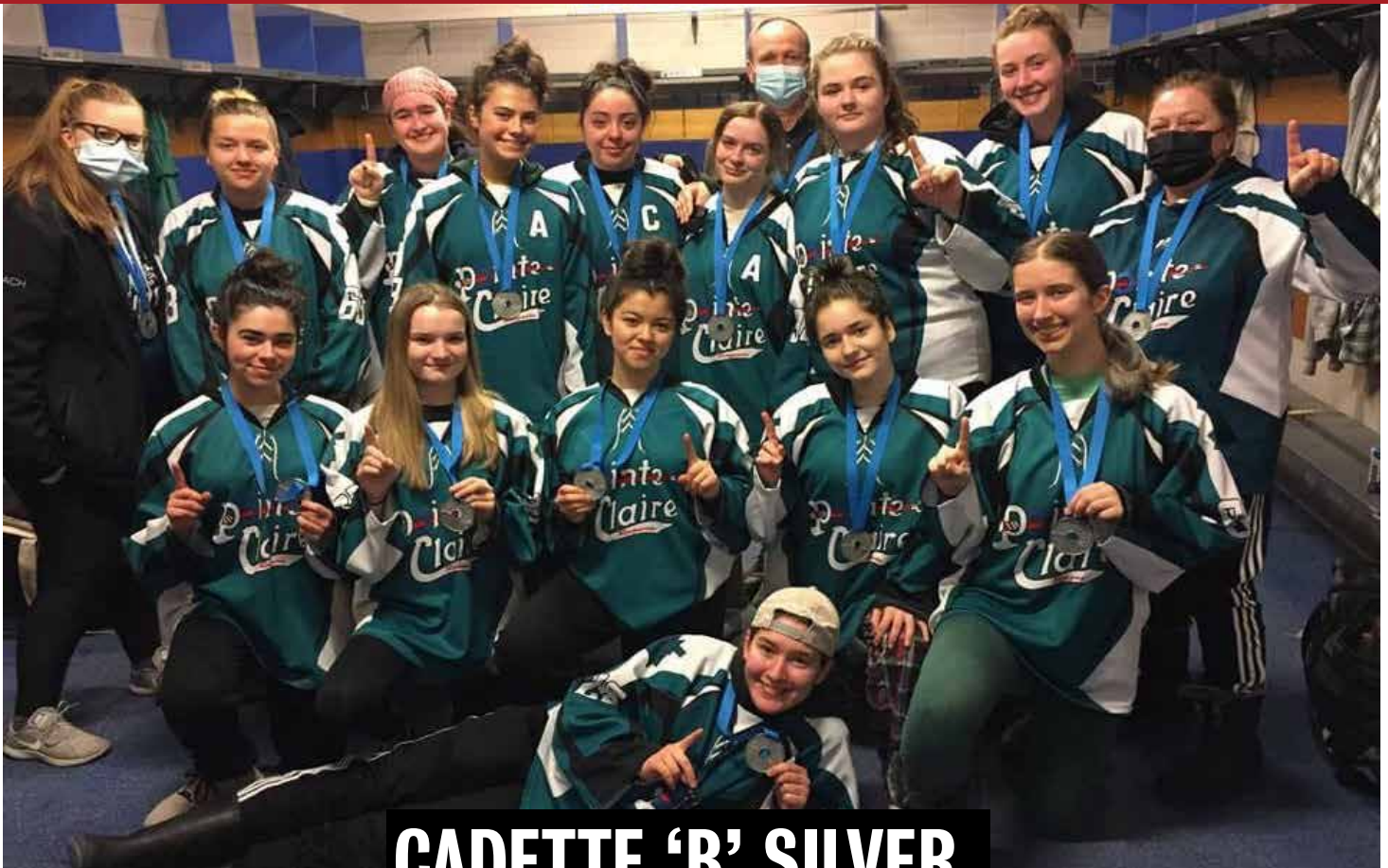
CADETTE 'B' SILVER