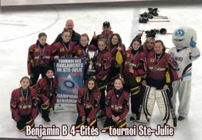
Benjamin B 4-Cités - tournoi Ste-Julie

MERCI A NOTRE COMMANDITAIRE / THANK YOU TO OUR SPONSOR