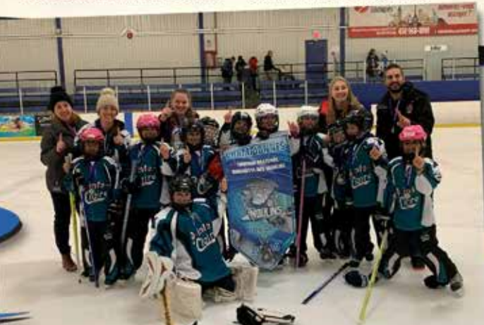
Novice A Pte-Claire - tournoi Des Moulins