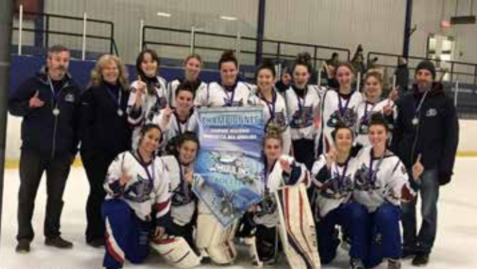
Cadette A Pierrefonds - tournoi Des Moulins