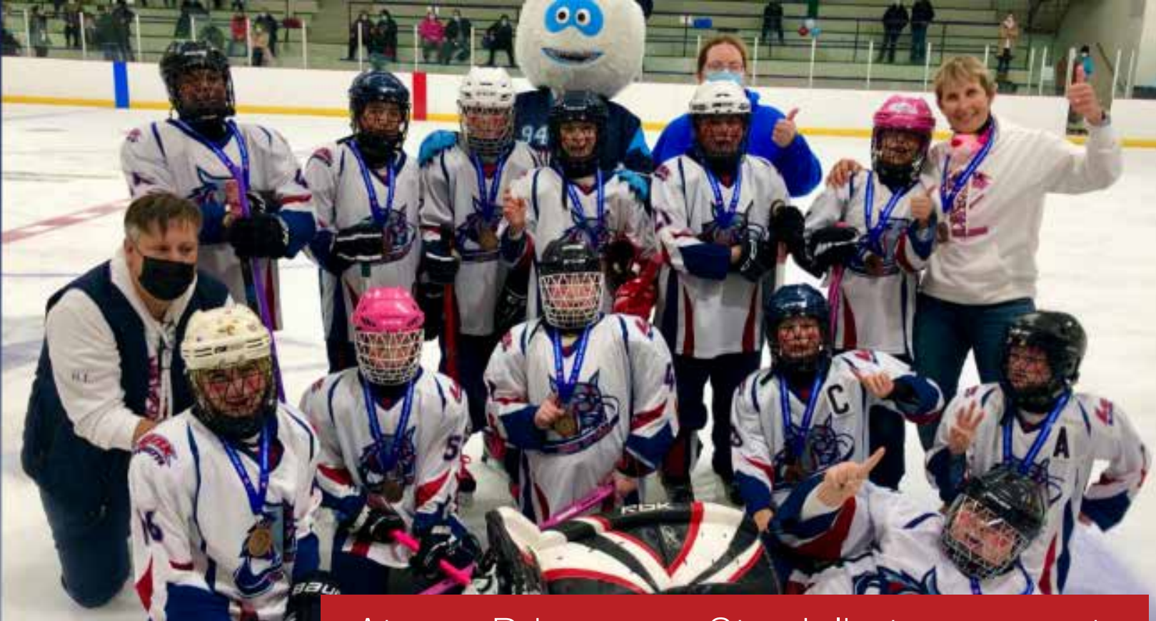
Atome B bronze - Ste-Julie tournament