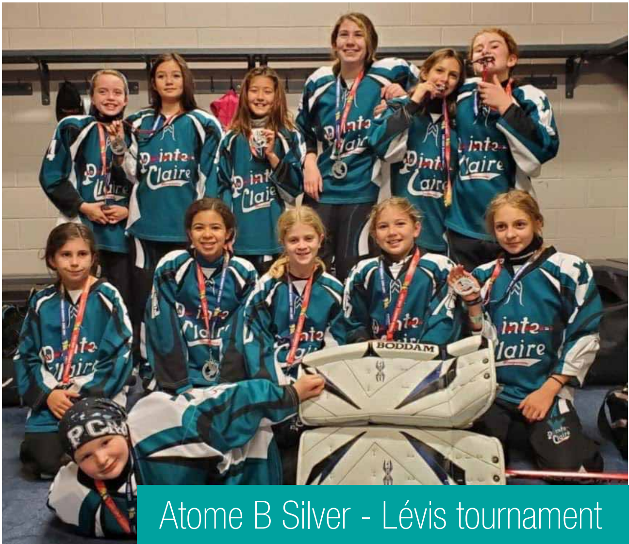
Atome B Silver - Lévis tournament