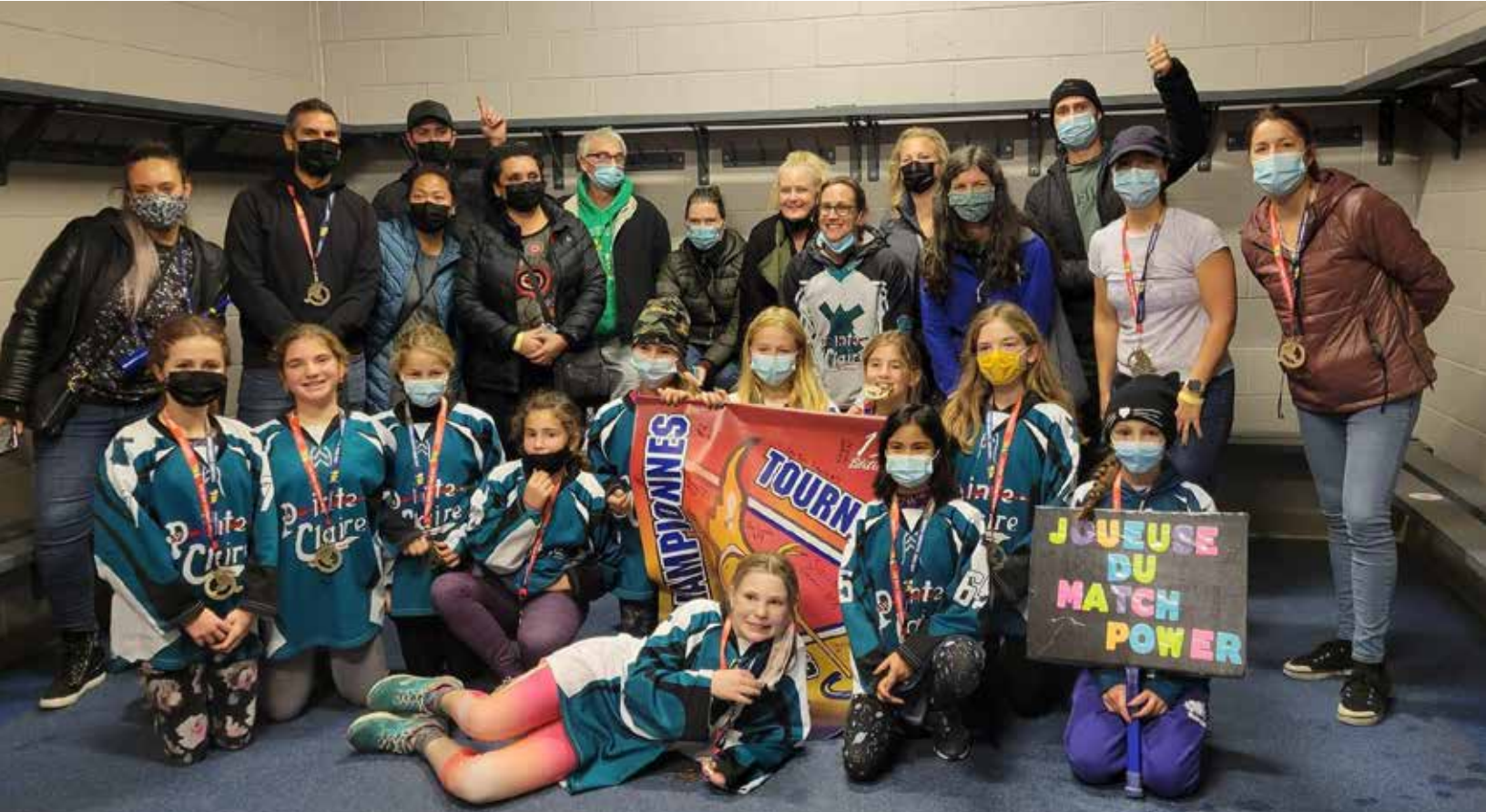
Atome A Champions Lévis Tournament