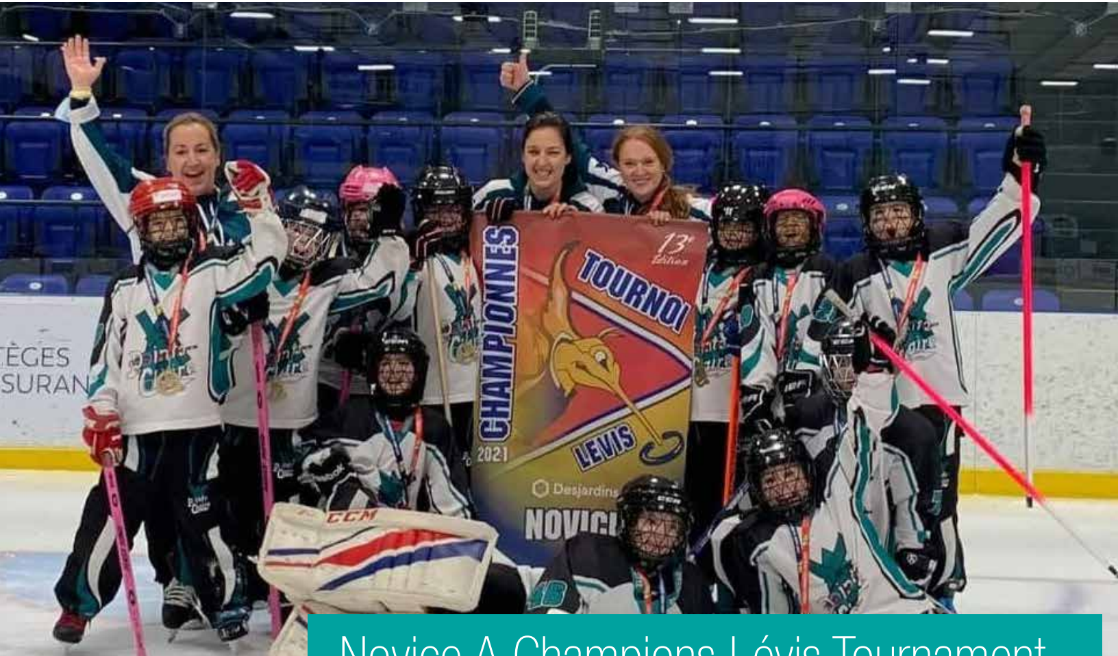
Novice A Champions Lévis Tournament